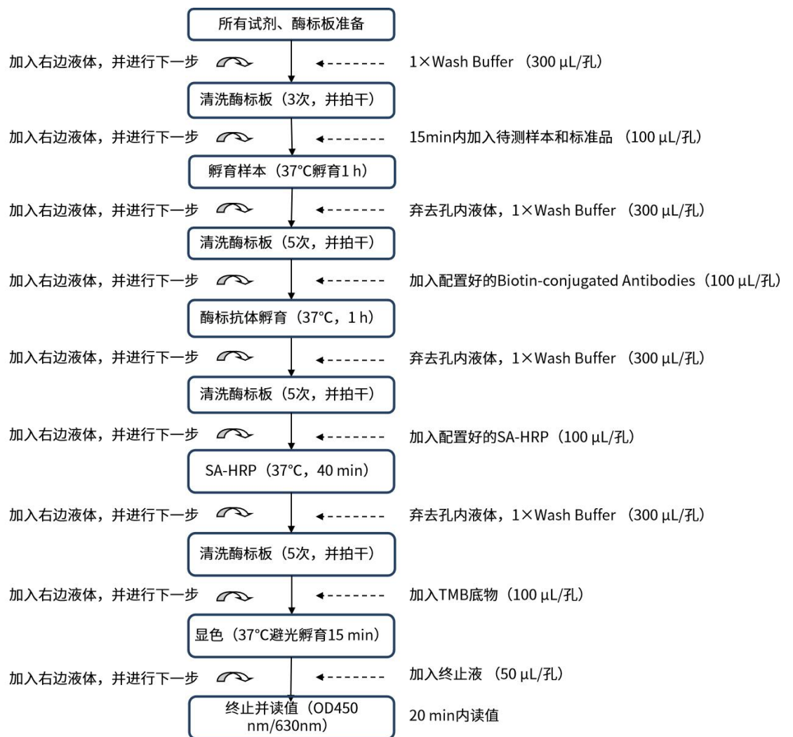
图 3: 实验步骤流程简图